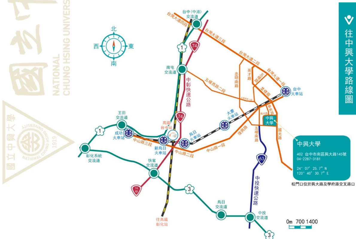
國立中興大學交通路線參考圖